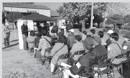
【災害ボランティアセンター訓練の様子】