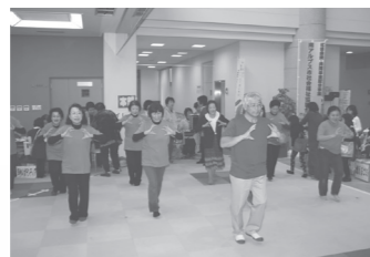
手話ステップ「ゆうあい」