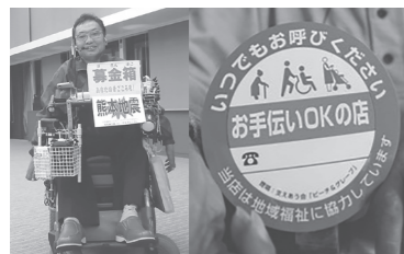
支えあう会 「ピーチ&グレープ」