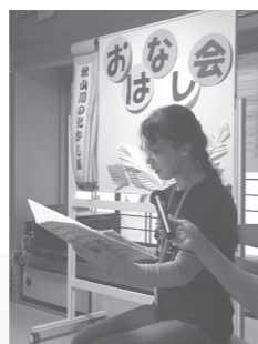
口述筆記ボランティア おひさま