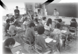
市内小学校でのふくし教育の様子