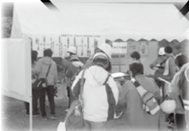
災害ボランティアセンター訓練の様子