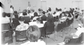
サロンフォローアップ研修の様子

近年多発している大規模災害時に多くのボランティアが全国から被災地へ駆けつけ被災者(地)の復旧・復興のお手伝いをしています。そのボランティアと被災者をつなぐ役割の災害ボランティアセンターの運営費も赤い羽根共同募金の配分金の一部を使用しています。南アルプス市社協では8月に岡山県倉敷市へボランティアバスを運行しました。その費用にも赤い羽根共同募金の配分金の一部を使用させていただきました。