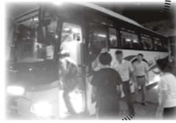
倉敷市へボランティアバスの運行

近年多発している大規模災害時に多くのボランティアが全国から被災地へ駆けつけ被災者(地)の復旧・復興のお手伝いをしています。そのボランティアと被災者をつなぐ役割の災害ボランティアセンターの運営費も赤い羽根共同募金の配分金の一部を使用しています。南アルプス市社協では8月に岡山県倉敷市へボランティアバスを運行しました。その費用にも赤い羽根共同募金の配分金の一部を使用させていただきました。