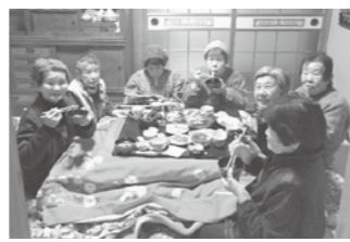
「地域に気軽につながる仲間がいることが、元気の源。」