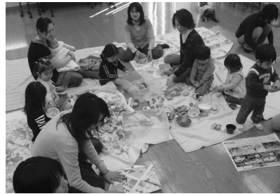
【子育てサロン実施事業】