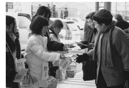
【昨年度、防災笛配りの様子】

啓発活動をしていただけるボランティアを募集します。参加希望の方は、地域福祉課 ☎283-4121 までご連絡ください。