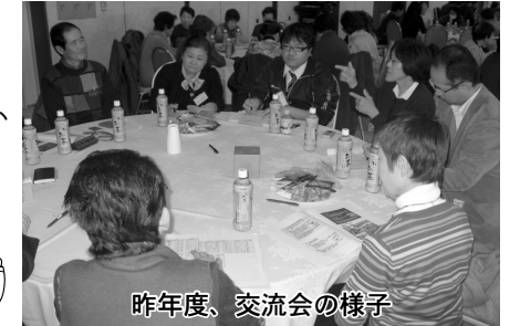
昨年度、交流会の様子

※今年度は、活動紹介だけでなく活動作品の販売等を考えております。展示ブースにて紹介や販売を希望する方は、1月20日(金)までに地域福祉課までご連絡ください。