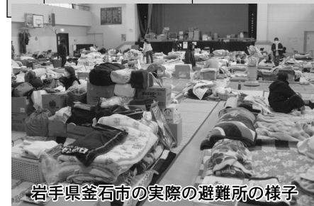
岩手県釜石市の実際の避難所の様子