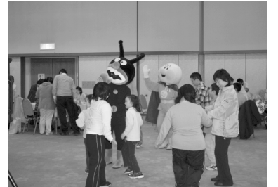
【昨年度のお楽しみ会の様子】