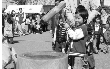
【昨年のちっくい祭りin甲西の様子】

当日は、靴を入れる袋とマイバッグをご持参ください。 駐車場が少ないのでなるべく乗り合わせでお越しください。