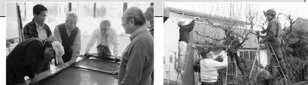
【えがの会 活動の様子】

☆対象者 南アルプス市在住の概ね60歳以上の男性 ☆定員 20名 ☆切 3月9日(金)【定員になり次第切ります】 ☆申込方法 電話にてお申込みください ☆問合せ・申込先 社協地域福祉課 ☎283-4121