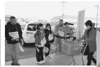
【ボランティア活動の様子】

◇日時 3月21日(水) 13:30~ ◇場所 社協ボランティアセンター ◇対象 サロン活動を行っている方、サロンについて関心のある方 ◇内容 活動報告書、助成金申請書作成の注意点、サロン保険の説明