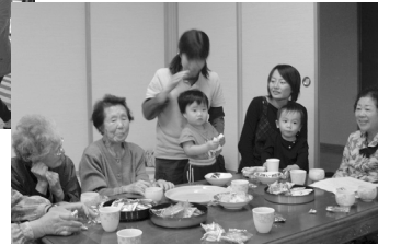
【サロン活動の様子】