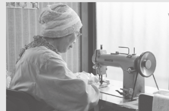
ちょっとしたボランティアを行っている方を紹介します。みなさまの身近な情報をお待ちしております。

「今のボランティア活動の基本は、以前裁縫の会社に勤めていた時の上司の教えである『作ってあげるのではない、させていただき、誰かの為に行うのだ。』という言葉にあります。その気持ちを胸に、毎日、今日は誰に会えるんだろうと楽しみながら生活しています。自分にできる範囲のボランティア活動を行って楽しんでいきます。」と、楽しそうにおっしゃっていました。