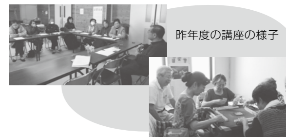
昨年度の講座の様子