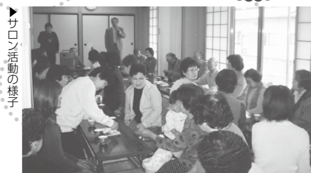
▶ サロン活動の様子

サロンは、公民館などを会場に、地域の方が気軽に集える場として、住民が中心になって企画・運営しています。また、サロン活動を通して生きがいや仲間づくり、情報交換など社会参加に結びつく交流の場になっています。現在市内には、50か所以上のサロンがあります。