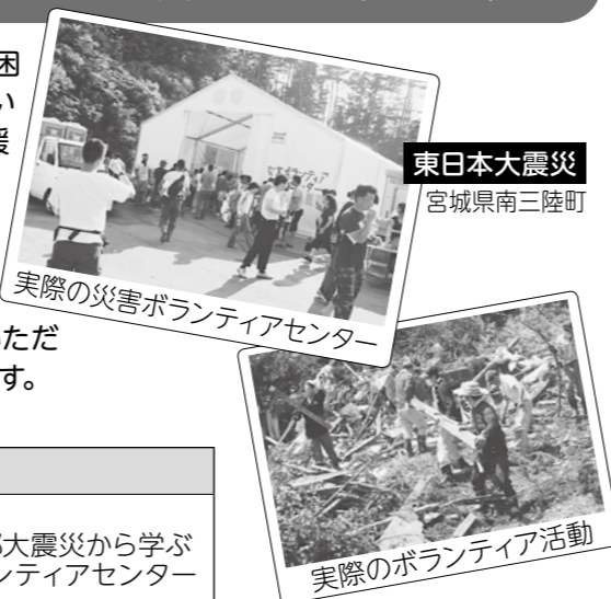
東日本大震災 宮城県南三陸町