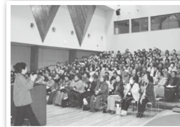
【昨年度の交流会の様子】

【申込み】下記の連絡先まで電話にてお申込みください。【メ切】2月5日(火)まで。 ※申込みの際に、どの分野に分かれて交流・意見交換会を行いたい希望までお教えください。 ※交流会当日は、展示ブースを設けます。自分たちの活動を紹介したい方や活動作品の販売等を考えている方は、申し込みの際にお伝えください。