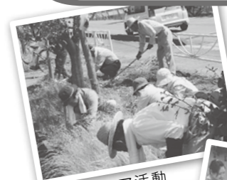
ボランティア活動の様子

今まで以上にボランティア活動を活発に行っていたらと、内容のスリム化を図り、活用しやすい助成金に変わりました。少しでも興味のある団体は、ご参加ください。