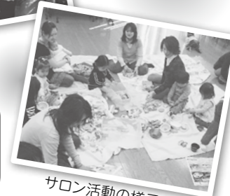
説明会後研修会を予定しています。