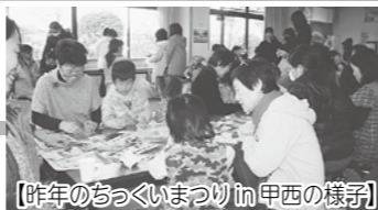
【今年のちっくいまつり in 甲西の様子】

ボランティアさんがつくる、地域をあったかくする手作りのおまつりです。おじいちゃんもおばあちゃんも子供たちもみんな来てください。お待ちしております。