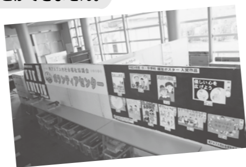
【小会議室兼相談室】 (最大 10 人まで使用可能)