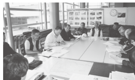
【大会議室】 (最大 20 人まで使用可能)