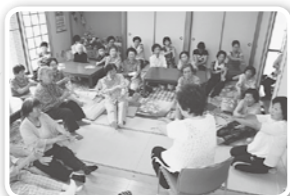
サロン活動の様子