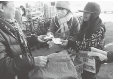
【昨年度の啓発活動の様子】

啓発活動を手伝っていただけるボランティアを募集します。参加希望の方は、地域福祉課 ☎ 283-4121 までご連絡ください。