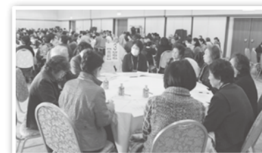
「昨年の交流会の様子」

【日時】2月22日(土) 13:00～15:30 (12:30受付) 【会場】若草生涯学習センター【南アルプス市寺部725-1】 【対象者】市内のボランティア団体、個人ボランティア、ボランティアに興味のある方 【内容】1 実践発表 2 テーマ別に分かれての交流・意見交換会 分野「高齢・障がい・子育て・防災・環境・ボランティア」