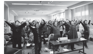
【昨年度の研修会の様子】