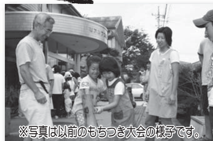
※写真は以前のもちつき大会の様子です。

世代を超えて地域の人々との心のふれあいや交流を深める『三世代交流』を目的に「豊く婦人の家」にて活動し、今年で11年目となりました。地域に伝わる歴史や文化等について高齢者から教わることから始まり、今までに多くの人達と出会い、交流しております。