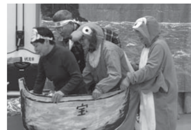
「甲州弁桃太郎」の劇の様子