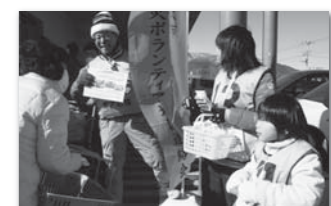
【昨年度の啓発活動の様子】

◇日時 1月17日(土) 10:30~11:30 ◇場所 Aコープこま野白根店・甲西店、ザ・ビッグ 櫛形店 ◇内容 店頭にて、災害用携帯トイレ、防災メッセージ入りポケットティッシュ、使い捨てカイロを配ります。