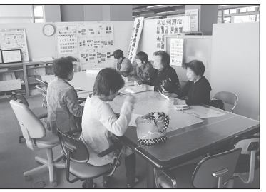
【大会議室】 (最大20人まで使用可能)