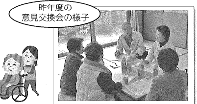
昨年度の意見交換会の様子