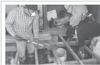
災害ボランティア活動の様子(常総市)

東海地震も含め、「いつ、どこで、どのような災害」が起きるかわからない今、訓練を通して、災害ボランティアセンターの機能を理解していただくことと、災害発生時にボランティアをスムーズに派遣できるよう訓練を行います。ぜひご参加ください。