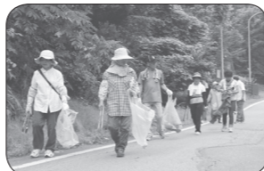
ゴミ拾いボランティアの様子

山梨県では、2月を「ボランティア・NPO活動推進月間」と定め、ボランティア・NPO活動へ積極的に参加できるように様々な活動を行っています。ボランティアを続けている方も、始めてみようかなと思っている方も、この機会に『新たな活動の一步』を踏み出してみませんか。少しでも興味があり、一步を踏み出したい（新たな活動をしたい）方は、地域福祉課 ☎ 283-4121 までご連絡ください。