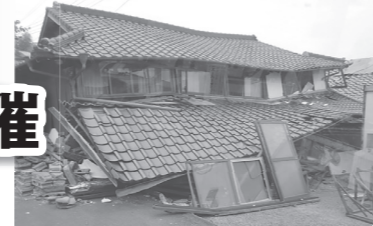
【熊本県益城町の様子】

近年多発している自然災害。そして、発生が危惧されている東海地震。いつどこでどのような災害が起きても、しっかりとした対応ができる「強いまち」を目指しましょう。