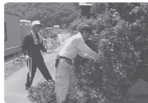
「男性ボランティアえがおの会」の活動の様子

山梨県では、2月を「ボランティア・NPO活動推進月間」と定め、ボランティア・NPO活動へ積極的に参加できるように様々な活動を行っています。ボランティアを続けている方も、始めてみようかなと思っている方もこの機会に『新たな活動の一步』を踏み出してみませんか。少しでも興味があり、一步を踏み出したい（新たな活動をしたい）方は、地域福祉課 ☎ 283-4121までお気軽にご連絡ください。