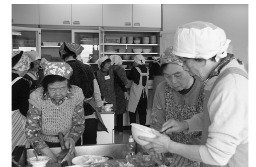
【健康料理教室の様子】