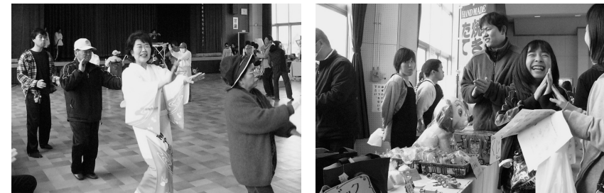
【昨年のちっくい祭りin甲西の様子】