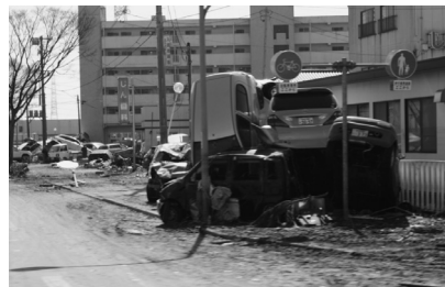
〔救援物資を届けた宮城県多賀城市の市街の様子〕

問合せ先：南アルプス市危機管理室 ☎282-6494 社協地域福祉課 ☎283-4121