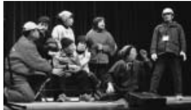
【ボランティアによる寸劇披露の様子】

出前講座をご希望の方は、地域福祉課（☎283-4121）まで問い合わせください。