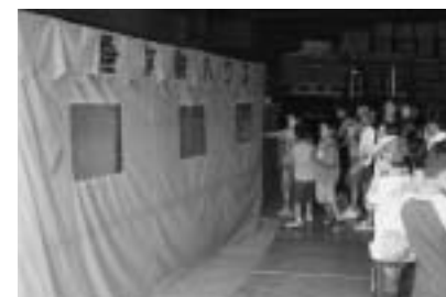
【昨年度スクールの様子】