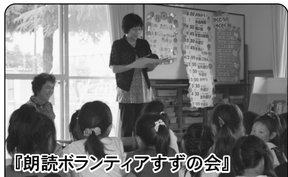
『朗読ボランティアすずの会』

南アルプス市内の児童クラブ2カ所へ3団体14名のボランティアが出向き、折紙教室、読み聞かせを行いました。ボランティアの一人は、「孫と一緒に住んでいないので孫のようにかわいかったです」とおっしゃっていました。