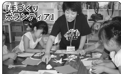
『手づくりボランティア』

7月27日、8月10日小笠原児童クラブにて「馬」「駒」「カエル」の折り方を教え、一緒に楽しく過ごしました。