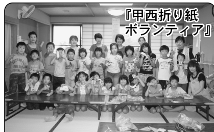
『甲西折り紙ボランティア』

7月28日櫛形西児童クラブにて「起き上がり」「駒」「ひらひらちょうちょ」の折り方を教え、一緒に遊びました。