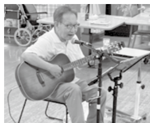
介護サービス事業所での芸能や特技披露