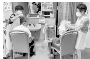
介護サービス事業所での利用者への支援や話相手