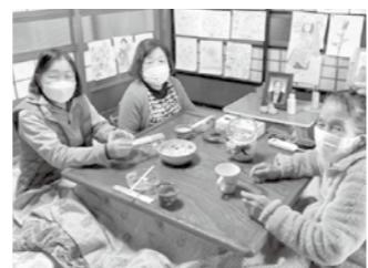
在宅での話し相手ボランティア

※市内の自治会や協議体、サロンや各種団体等への出張講座も承ります。お気軽にご相談ください。