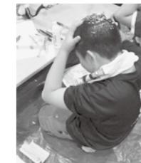
【ドライシャンプーを体験している様子】