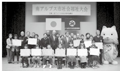
第21回大会表彰者等記念撮影の様子

コミュニティーソーシャルワーカー(CSW)の実際の事例を通して、CSWの活動を知っていただき、地域でそれぞれがふみ出せる一歩を話し合います。ぜひふくし勉強会にご参加ください。お待ちしております!!